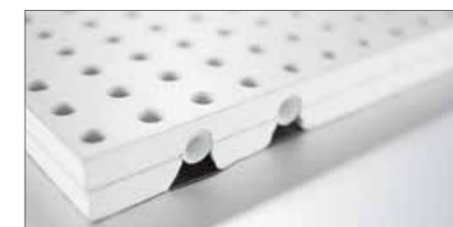
Akustičen hladilni strop