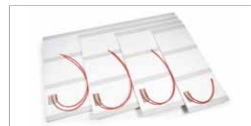
Strop za sevalno ogrevanje in hlajenje