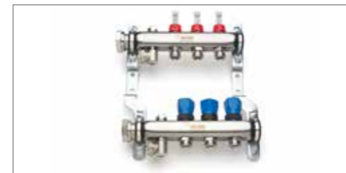
Razdelilnik ogrevalne zanke iz legiranega jekla