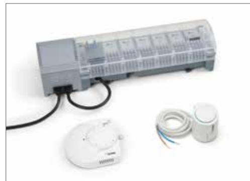
RAUMATIC R – radijsko vodena regulacija