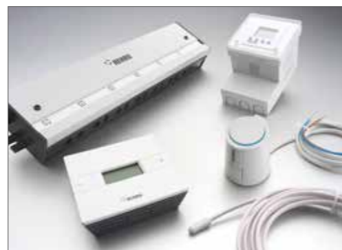
NOVO Regulacija za posamezen prostor Nea