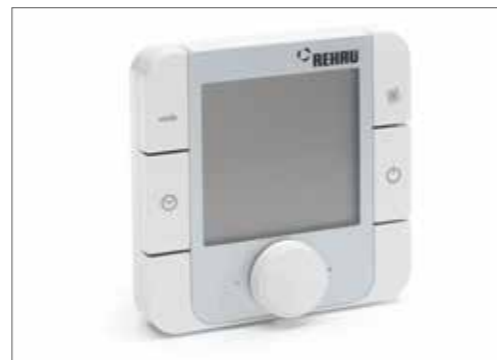
NOVO Regulacijska tehnika HC BUS